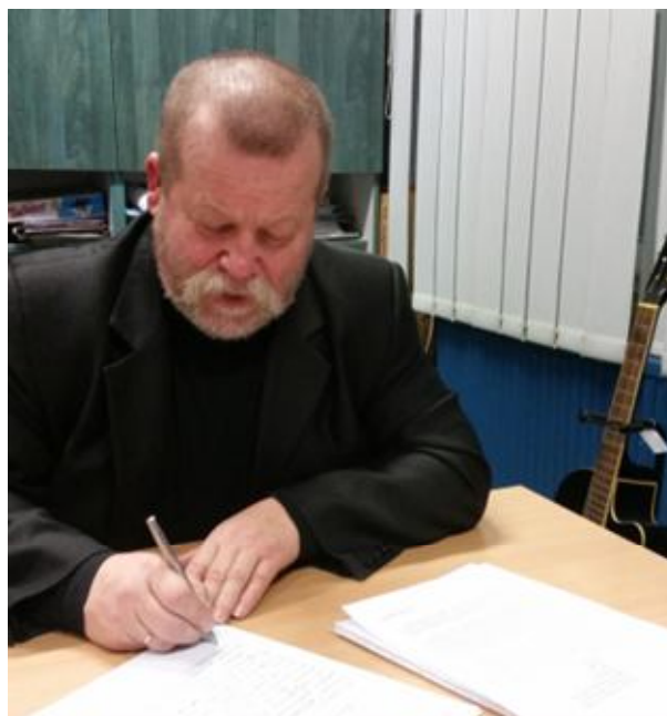
Pan dyrektor również dołączył się do akcji ☺