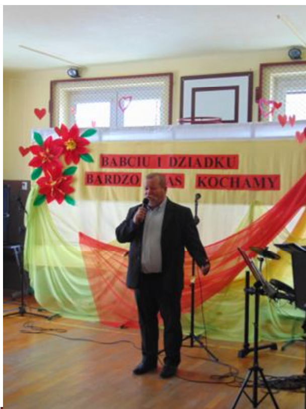
Tu i teraz-bis