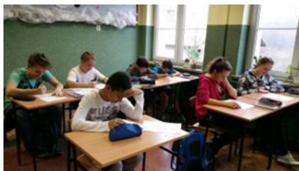
Uczniowie klasy I gimnazjum