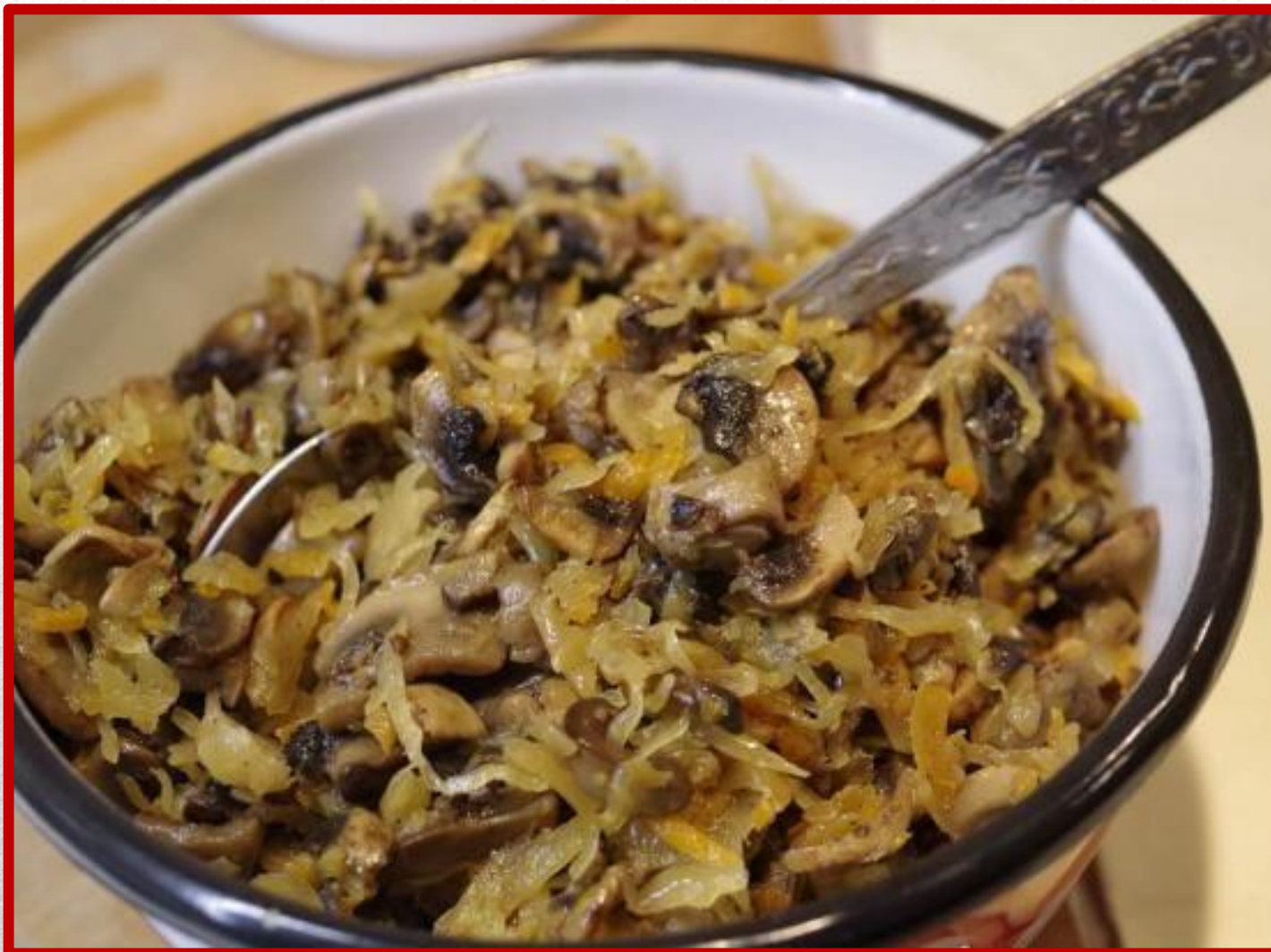
KAPUSTA Z GRZYBAMI