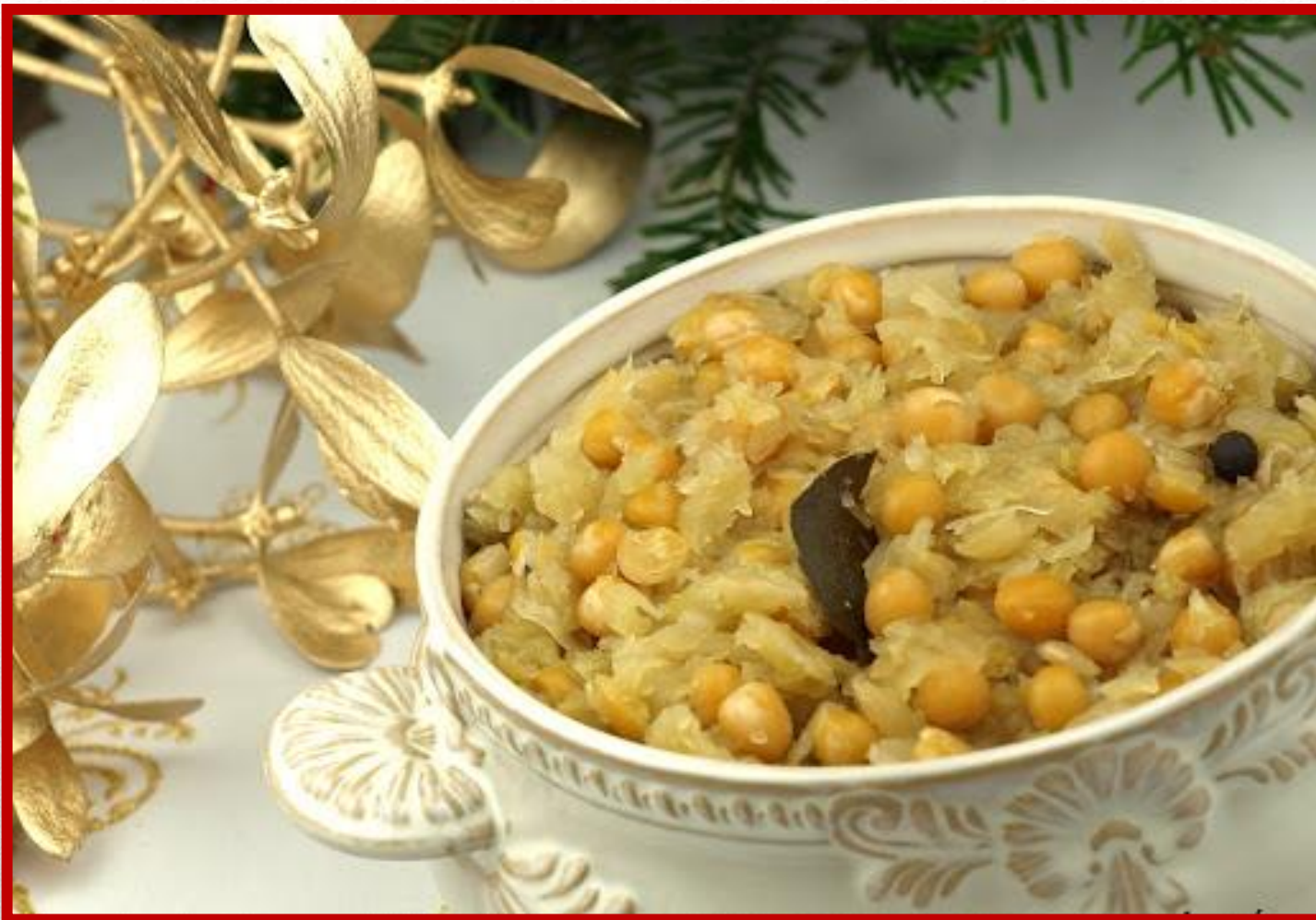
KAPUSTA Z GROCHEM