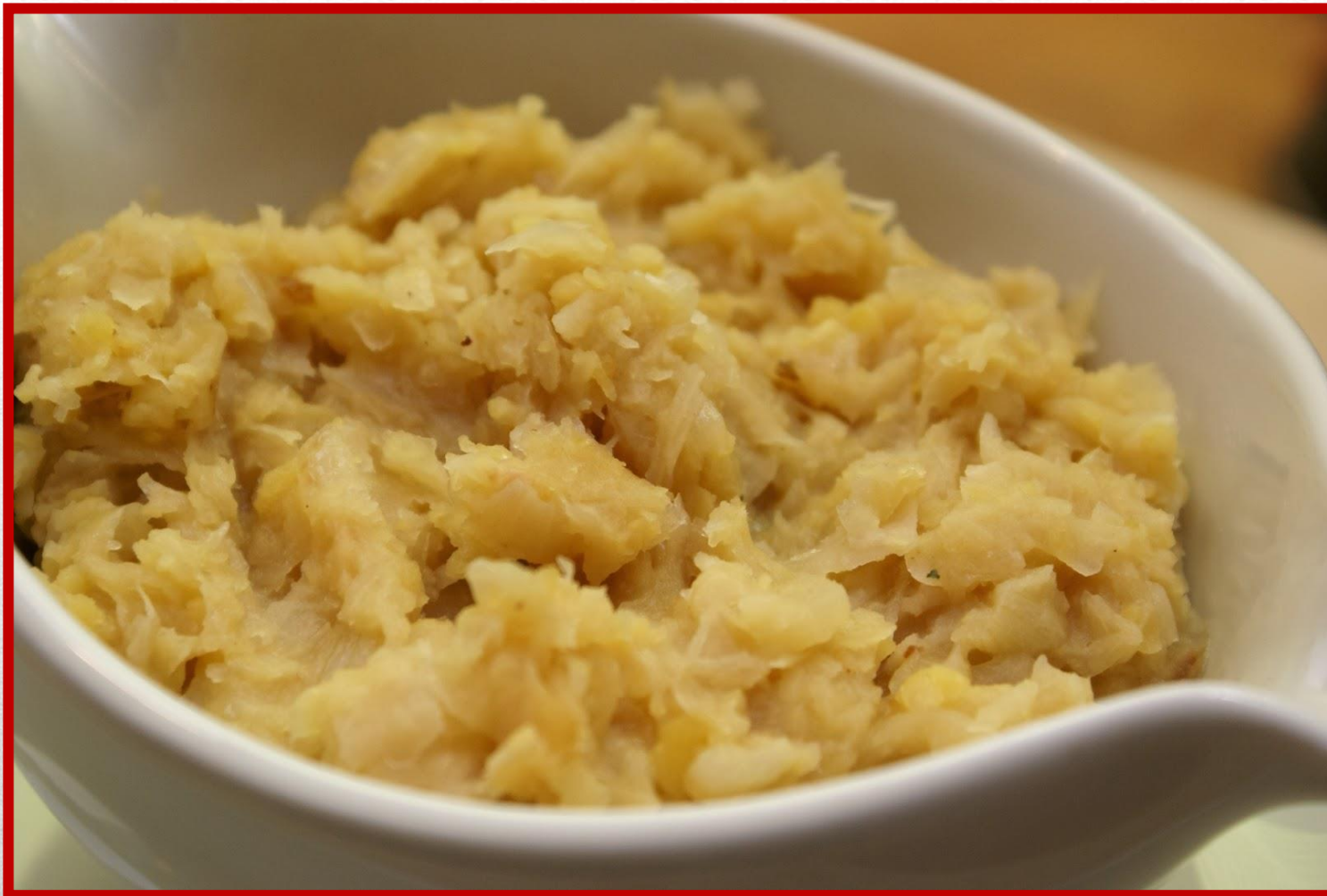
KAPUSTA Z GROCHEM