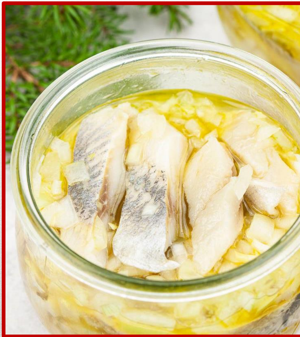
ŚLEDŹ W OLEJU