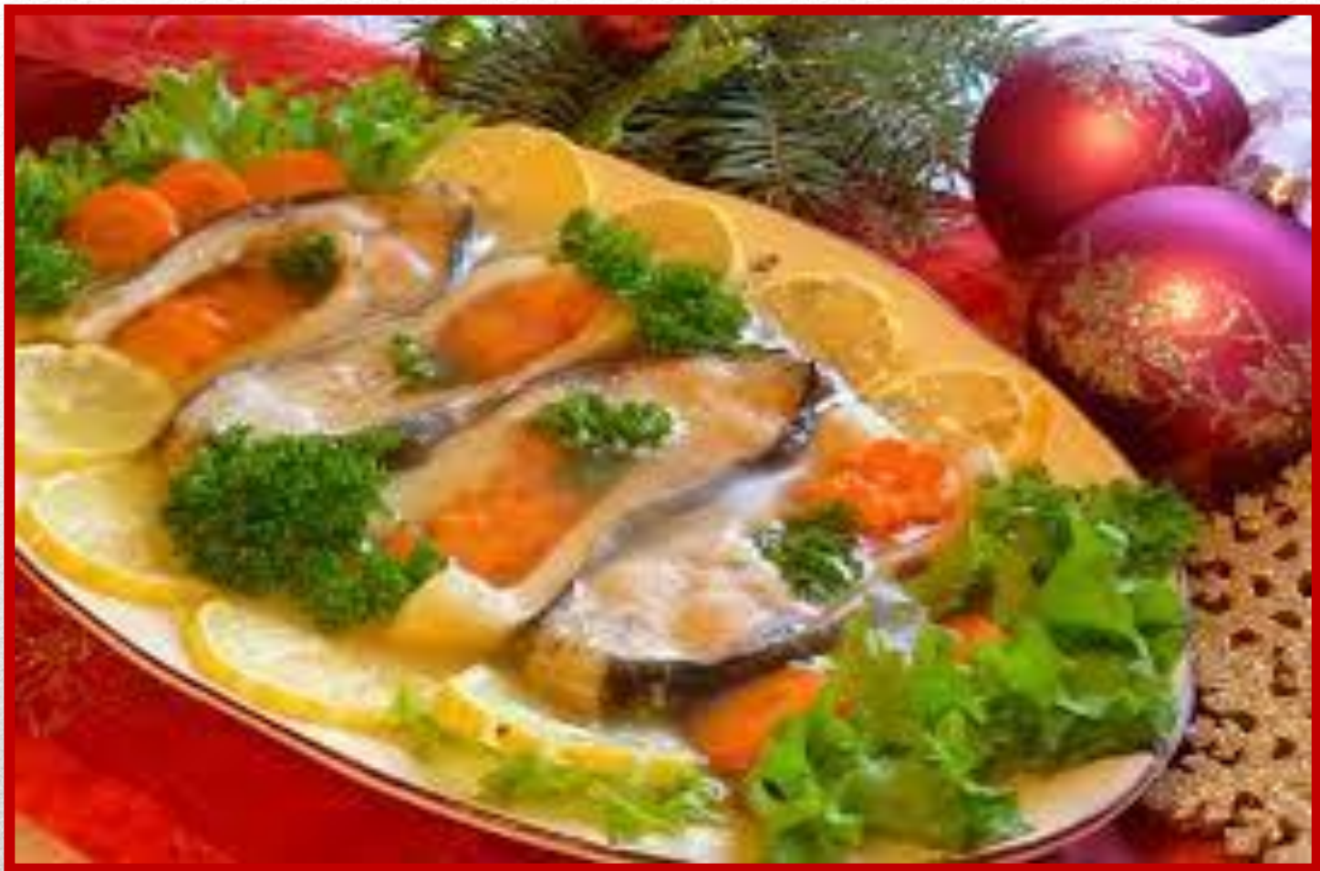
KARP W GALARECIE