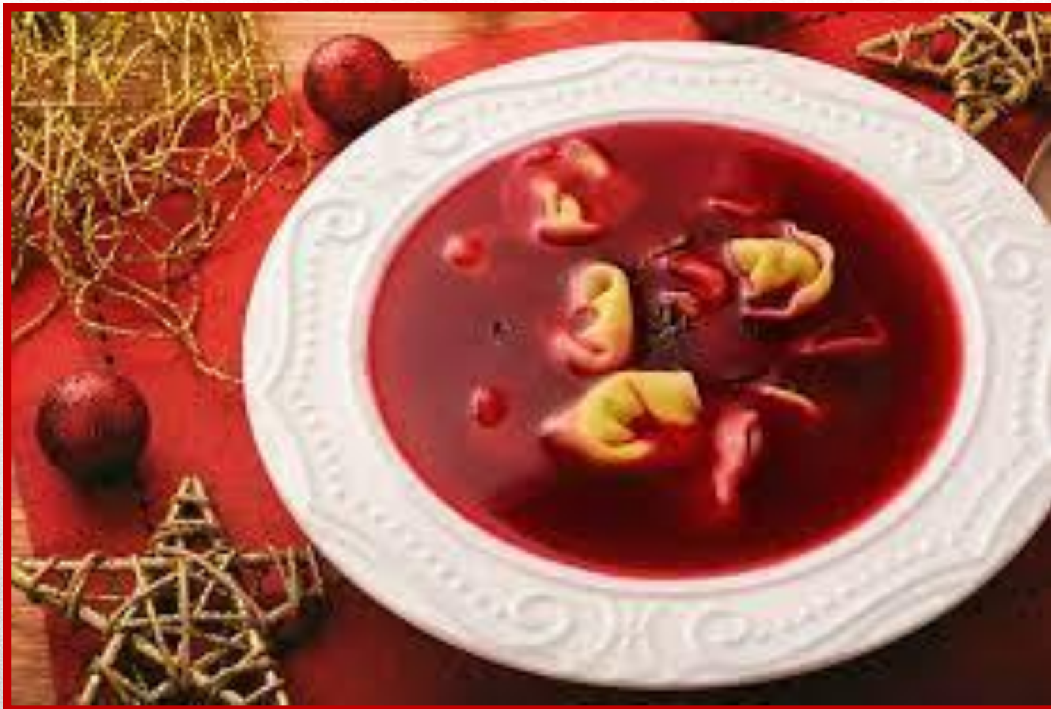
BARSZCZ Z USZKAMI