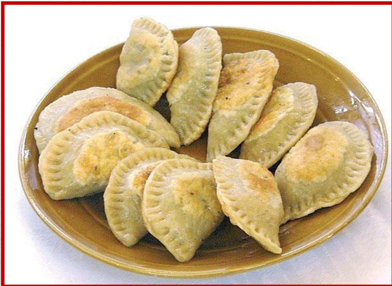
PIEROGI Z KAPUSTĄ I GRZYBAMI