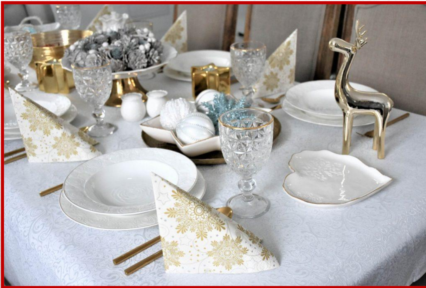
BIAŁY OBRUS NA STOLE WIGILIJNYM