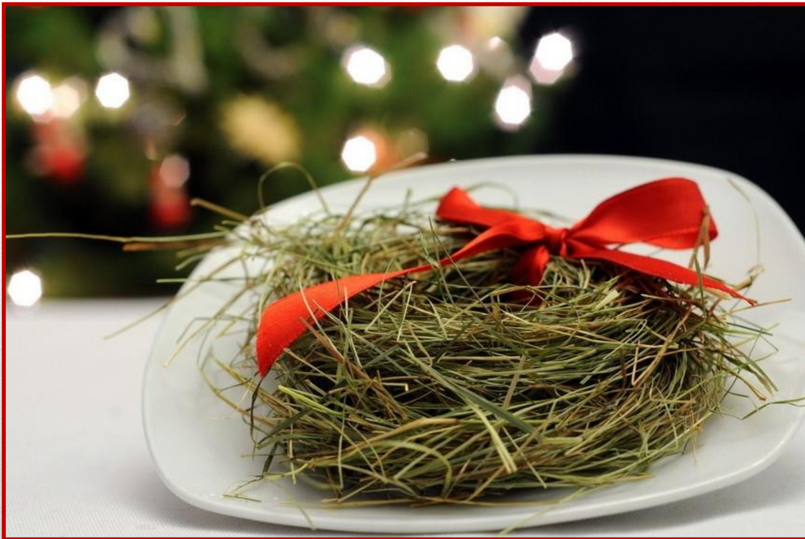
SIANKO NA STÓŁ WIGILIJNY