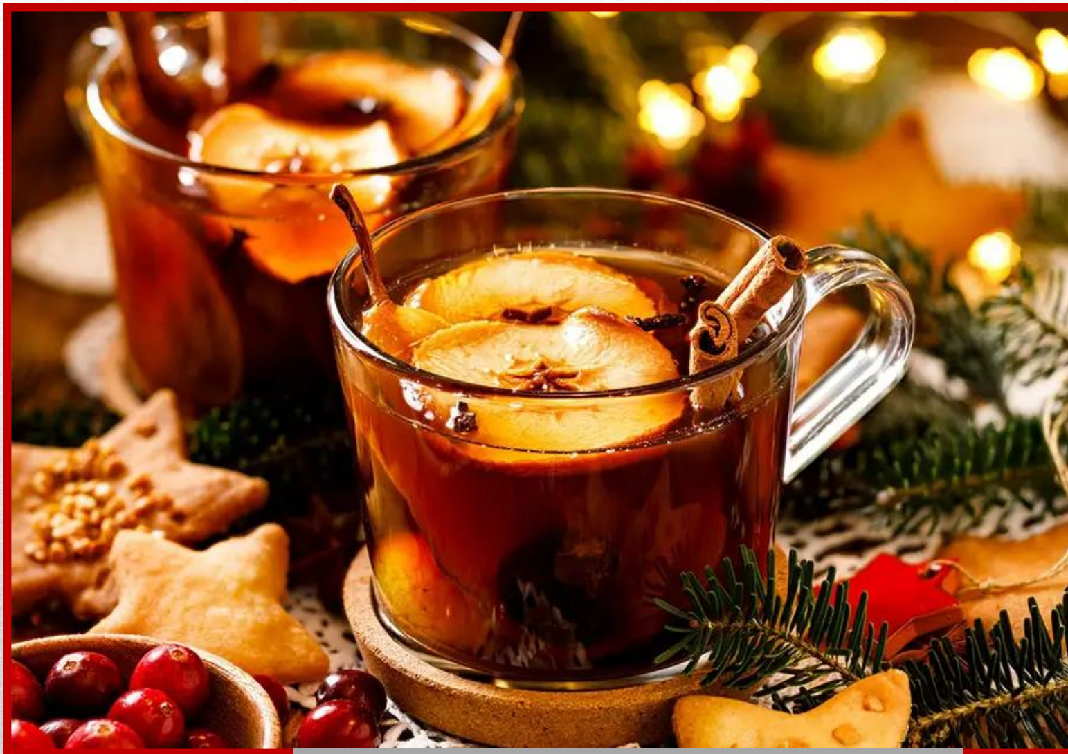
KOMPOT WIGILIJNY Z SUSZU