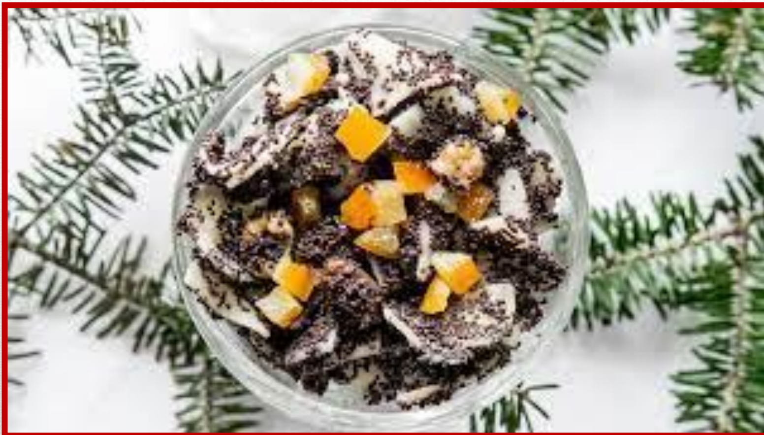
KLUSKI Z MAKIEM