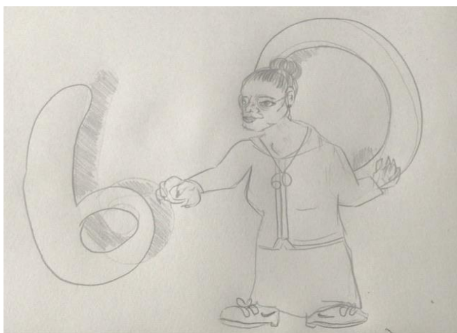
Ilustracja wykonana przez Matyldę Woźniak, kl. 7