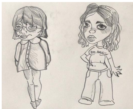
Ilustracja wykonana przez Matyldę Woźniak

Natomiast w XXI wieku moda w szkole stała się bardziej zróżnicowana niż kiedykolwiek. Jest teraz o wiele bardziej indywidualna i swobodna, w szkole, jak i poza nią, każdy ubiera się w jakiegokolwiek ubrania chce (byleby tylko nie złamać regulaminu swej szkoły).