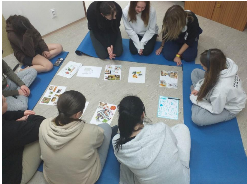
Dievčatá sa tešia sa na ďalšiu aktivitu.