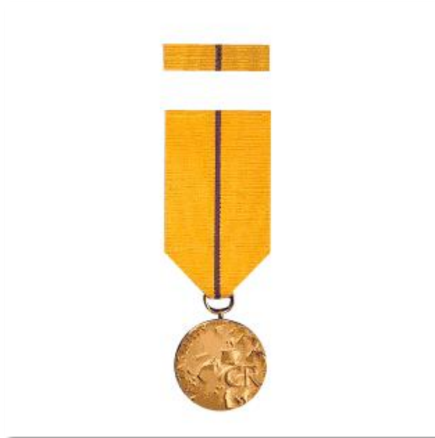
české štátne vyznamenanie – medaila Za zásluhy 1. triedy