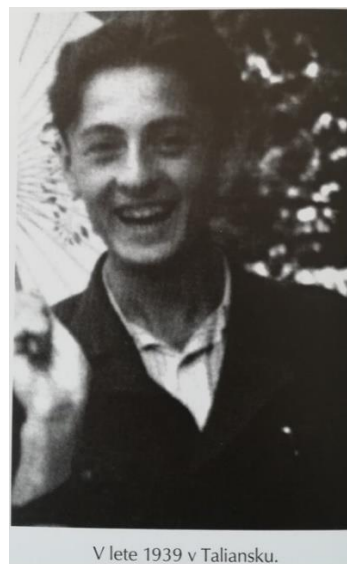
V lete 1939 v Taliansku.