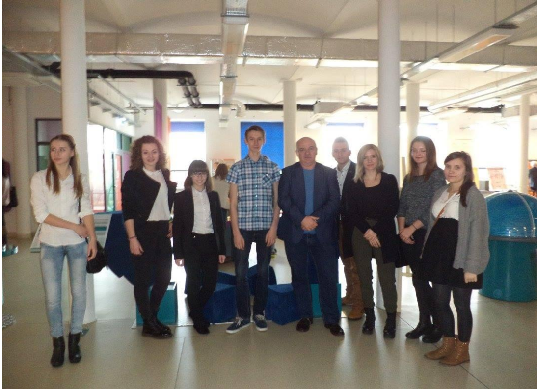
Wojewódzki Konkurs Astronomiczny „Odkryjmy tajemnice Wszechświata” - wyróżnienia