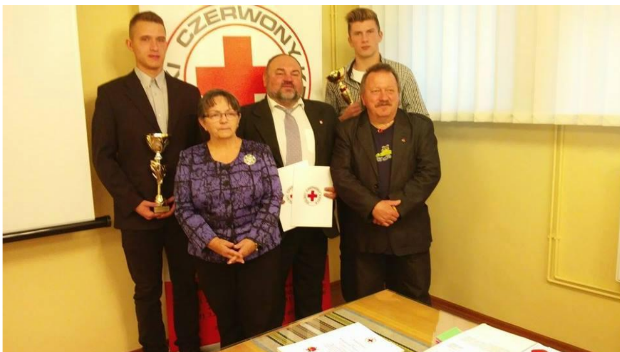
Lubuski Oddział Okręgowy Polskiego Czerwonego Krzyża przyznał naszej szkole wyróżnienia „za największą ilość oddanej krwi” oraz „za najwyższy wskaźnik aktywności szkoły”.