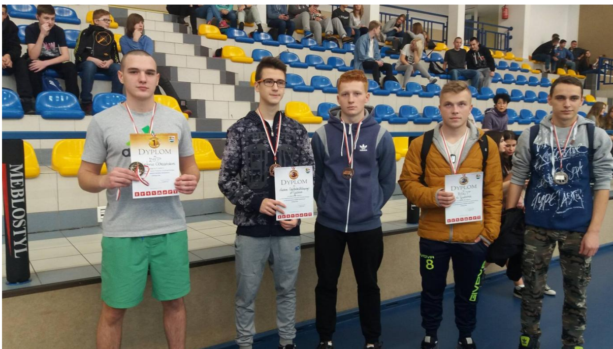
Mistrzostwa Powiatu Krośnieńskiego Szkół Ponadgimnazjalnych w tenisie stołowym chłopców