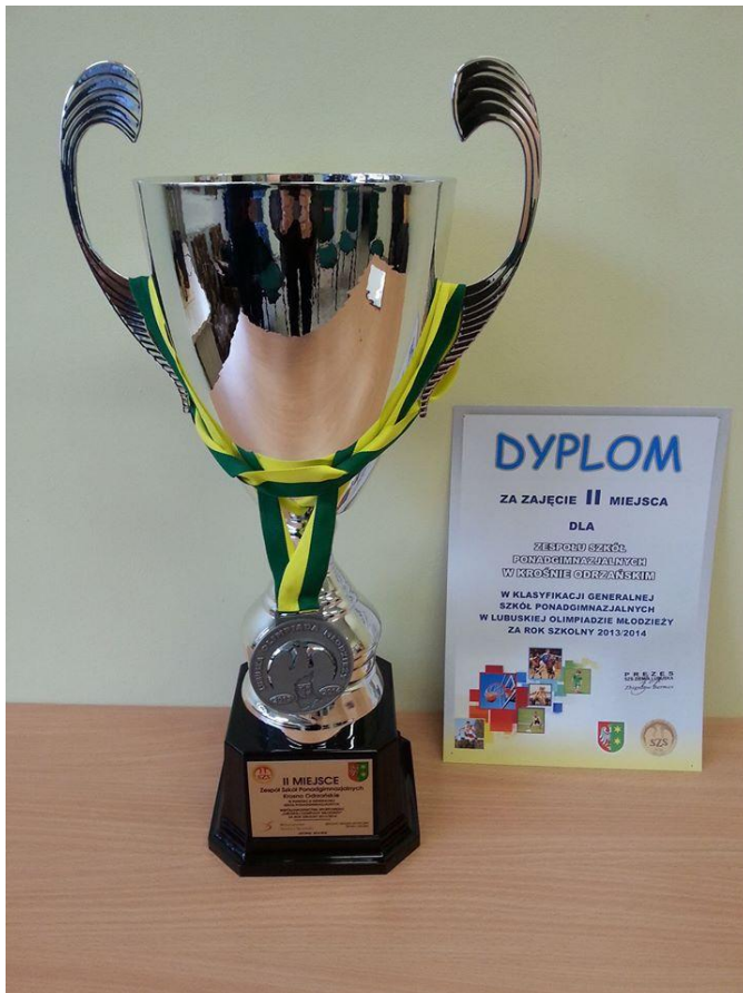
Puchar za zajęcie II miejsca w Lubuskiej Olimpiadzie Młodzieży w roku 2013/2014