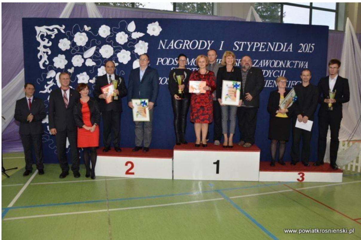
Podsumowanie Współzawodnictwa Sportowego XVI edycji Mistrzostw Powiatu Krośnieńskiego - I miejsce