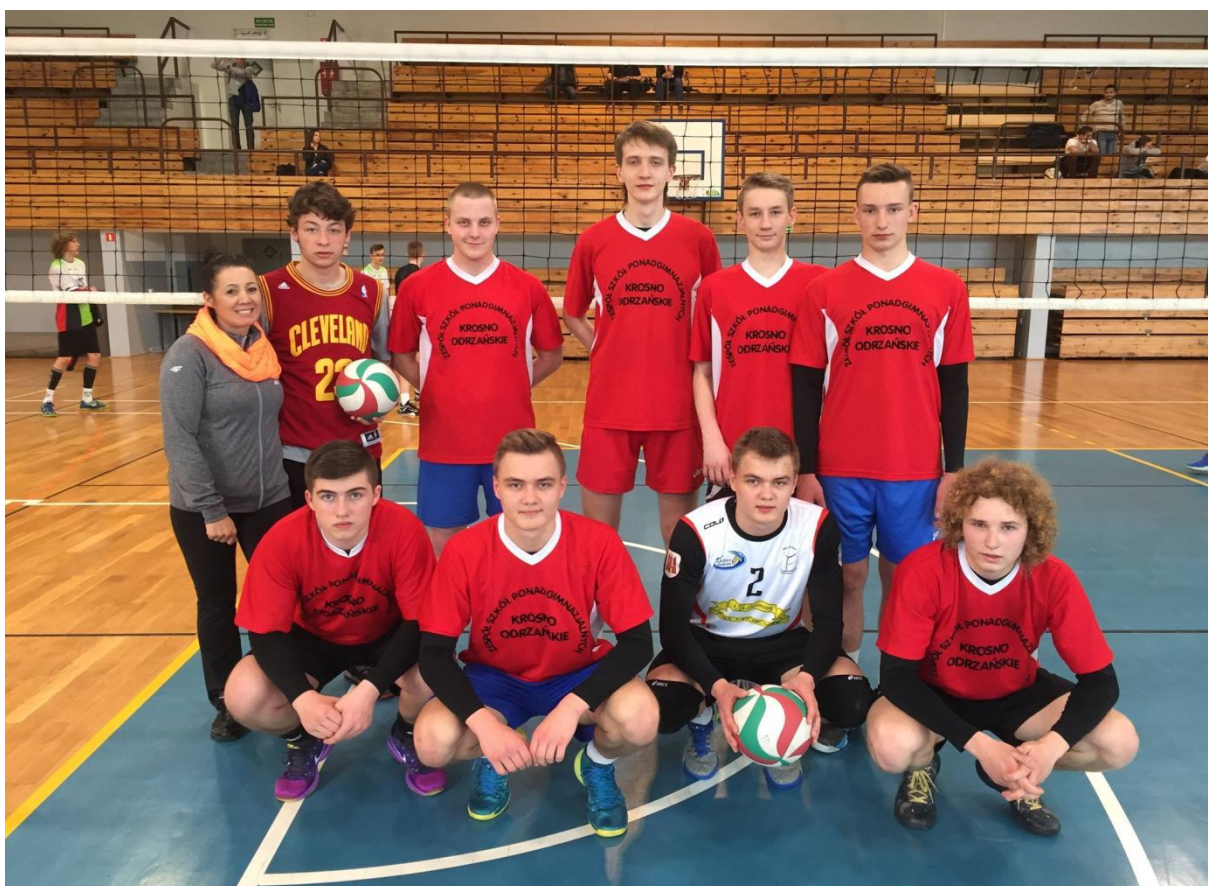
Półfinał Województwa w piłkę siatkówkę chłopców - I miejsce i awans do FINAŁU WOJEWÓDZTWA!