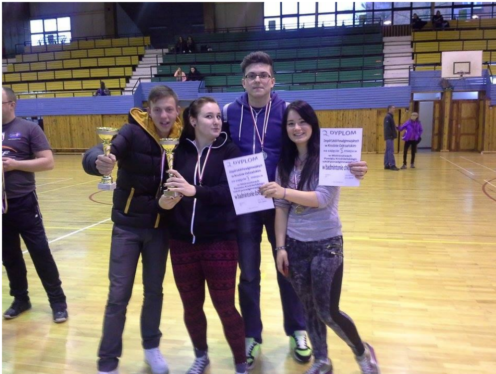
Mistrzostwa Powiatu Krosnieńskiego Szkół Ponadgimnazjalnych w badmintonie dziewcząt i chłopców I znów I miejsca :)