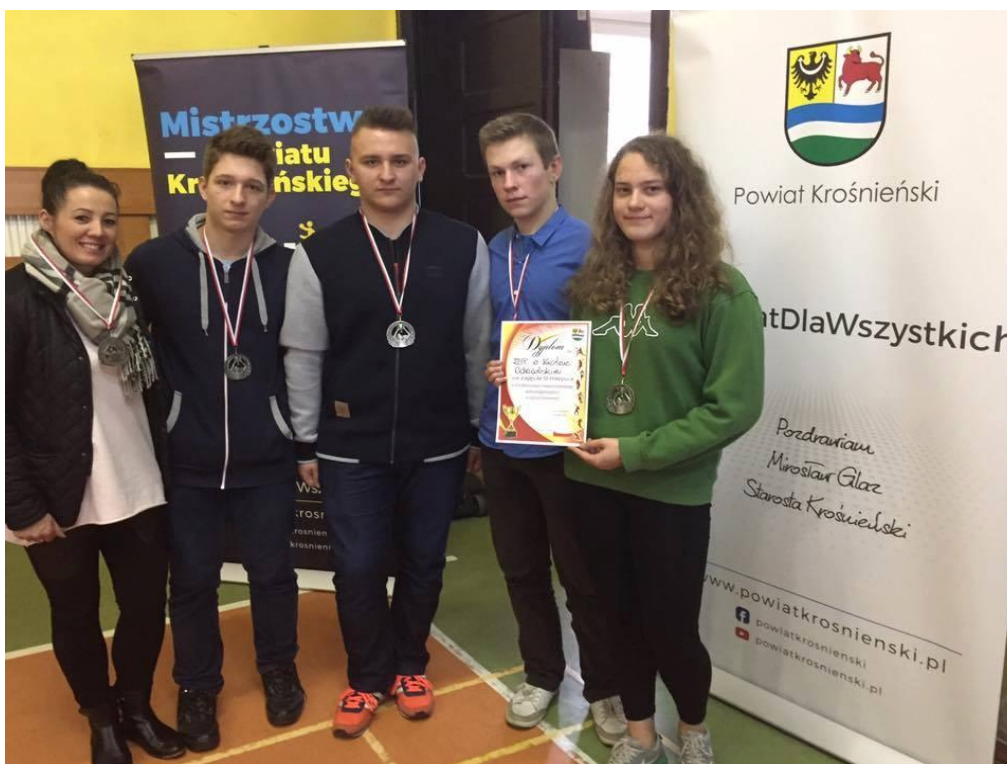
Mistrzostwach Powiatu Krośnieńskiego szkół Ponadgimnazjalnych w szachach drużynowych - II miejsce