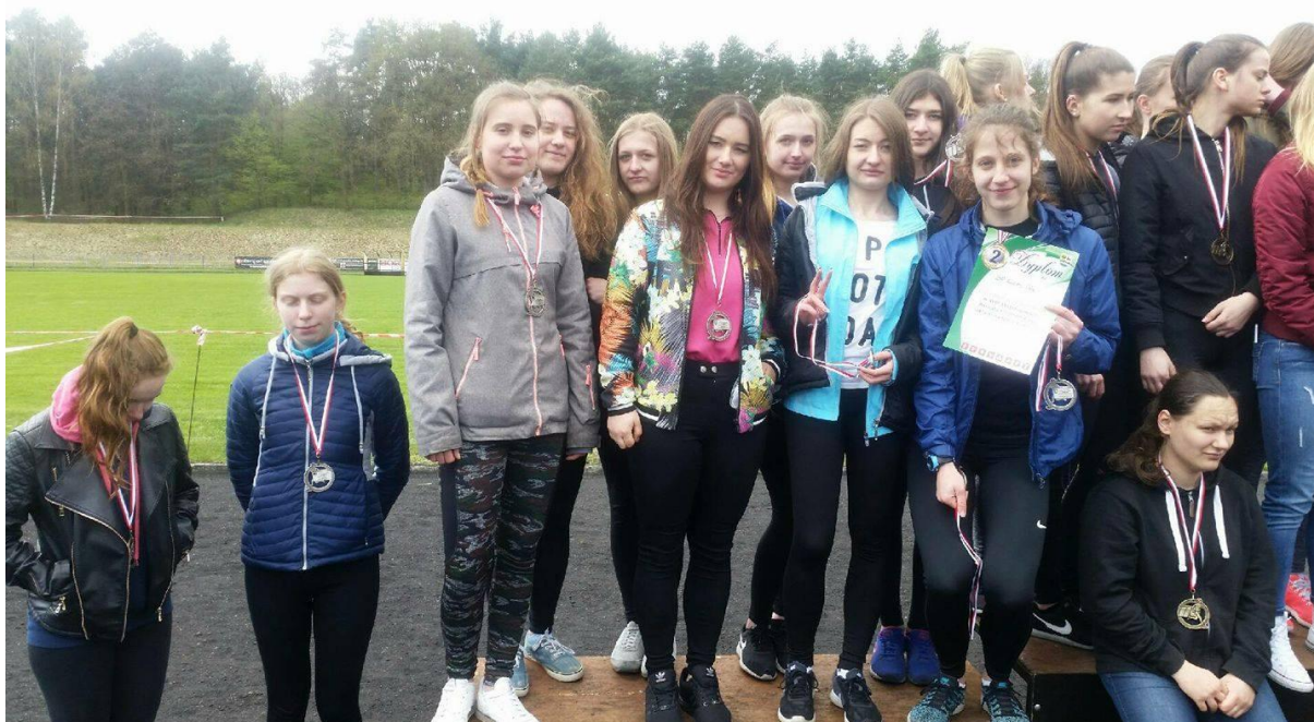
Mistrzostwa Powiatu Krośnieńskiego Szkół Ponadgimnazjalnych w sztafetowych biegach przełajowych dziewcząt - II miejsce