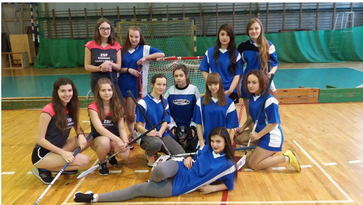
Mistrzostwa Powiatu Krośnieńskiego Szkół Ponadgimnazjalnych w unihokeja dziewcząt - I miejsce