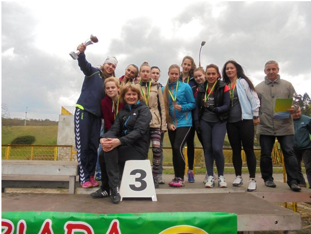
Finale Lubuskiej Olimpiady Młodzieży w biegach przełajowych dziewcząt - III miejsce