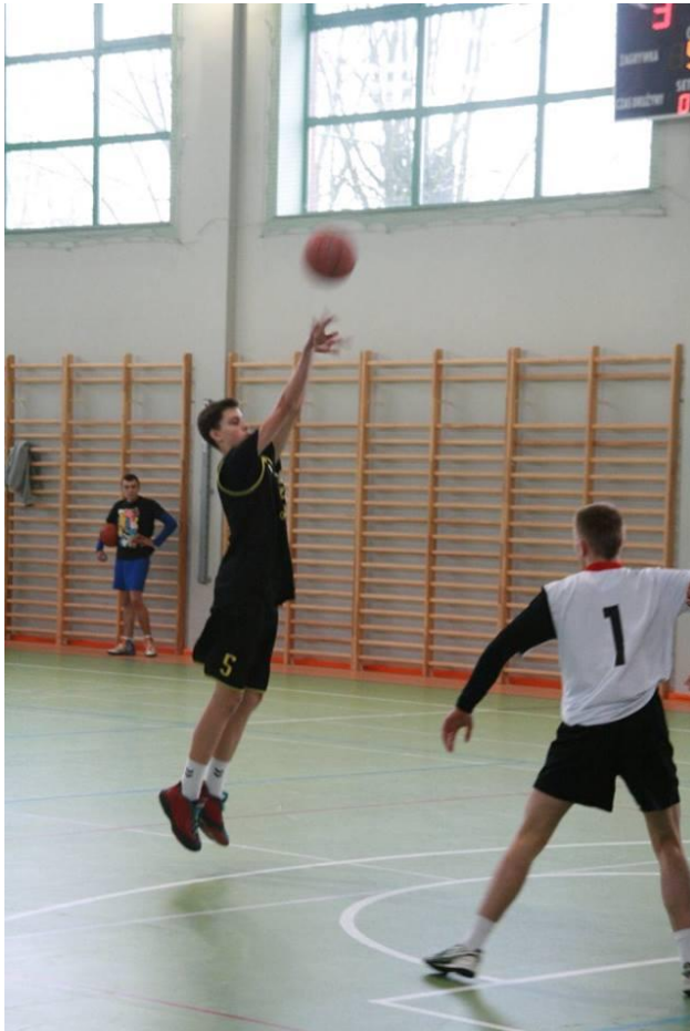
Mistrzostwa Powiatu Krosnieńskiego Szkół Ponadgimnazjalnych w koszykówce - nasi uczniowie zajęli I miejsca w kategorii dziewcząt i chłopców.