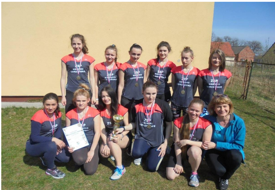
Mistrzostwa Powiatu Krośnieńskiego Szkół Ponadgimnazjalnych w sztafetowych biegach przełajowych dziewcząt - I miejsce, chłopcy - I miejsce