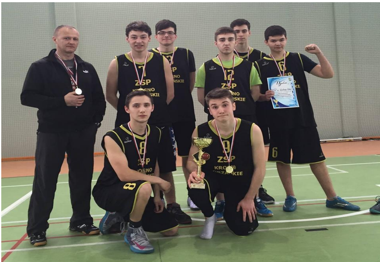
Mistrzostwa Powiatu krośnieńskiego w piłce koszykowej dziewcząt i chłopców - I miejsce