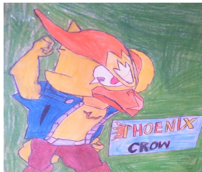
Wyk. Maciej Spadło kl. 6