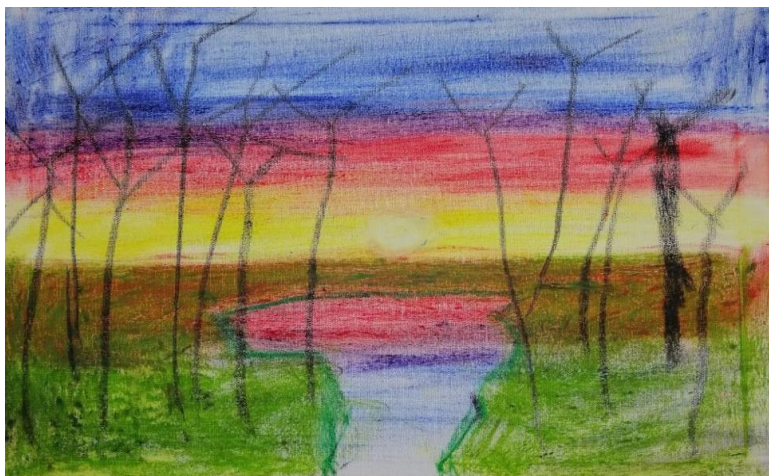
Wyk. Mikołaj Szumielewicz kl. 5