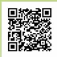
Programovanie na Cypre