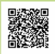
Gondolkodj a Pázmányban