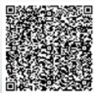
Vedenie univerzity ocenilo cvičné školy