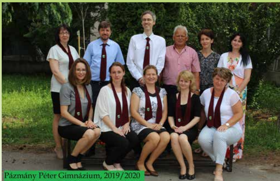
Pázmány Péter Gimnázium, 2019/2020