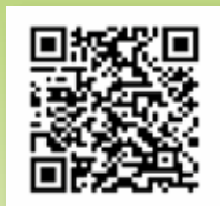
Mit lehetett online megtanulni