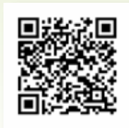
Az online oktatás egy középiskolás szemével