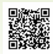
Az Erasmus+ arcnak műhelyitkai