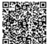
Példaértékű önkormányzati segítség